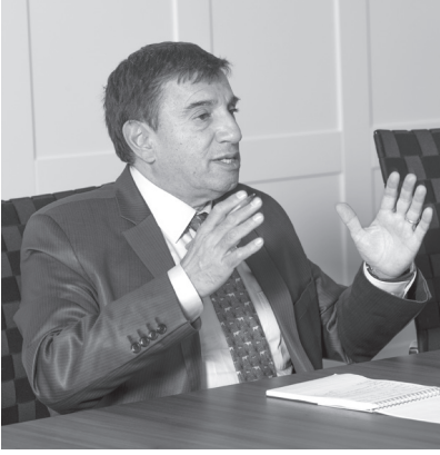
Prof. Dr. Üstün Dökmen (2018)