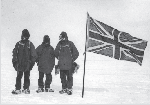
Shackleton arkadaşlarıyla dünyanın en güney noktasına giden kişi oluyor. 9 Ocak 1909.

Discovery seferine ise Scott ve Shackleton birlikte katılmışlardı. Bu yolculuk 31 Temmuz 1901'de başlamış, ikisi arasında anlaşmazlık çıkmış ve dönüş yolculuklarını ayrı yapmışlardı.